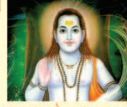
सतगुरु गोरखनाथ बाबा